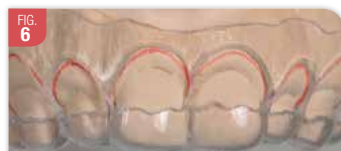
Difficulté à suivre le tracé lors de la découpe du guide. Le feston du guide n'est ni régulier ni symétrique et il ne suit pas le tracé sur le modèle.

Pour s'affranchir des limites du guide traditionnel, on peut désormais réaliser, après planification numérique, un guide avec une imprimante 3D (Fig. 8). Cette solution rend la