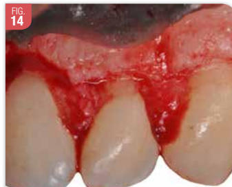
FIG. 14 Après correction osseuse et rétablissement d'un espace biologique. À noter aussi, la difficulté de distinguer la JAC, ici en particulier sur la 23.

ciseaux à os et d'une pince Gouje. Ce sont des retouches importantes qui, selon nous, font de cette chirurgie un acte invasif et technique. Là aussi, il convient d'être vigilant car la JAC n'est pas toujours évidente à distinguer. Le changement de couleur entre la racine et la couronne est parfois très léger (Fig. 14).