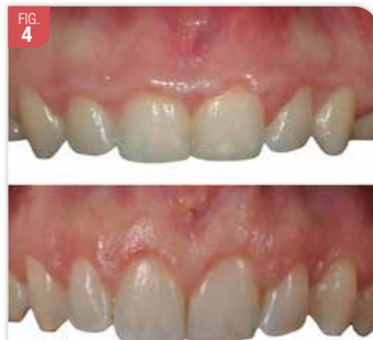
Situation Avant / Après chirurgie. Le résultat est satisfaisant mais ce n'est pas symétrique entre 11 et 21. Le zénith gingival et donc la courbure du feston ne sont pas identiques.

En cas de gingivectomie, le tracé d'incision est essentiel. Il conditionne le résultat esthétique. Mais, il est délicat puisqu'il faut à main levée redonner un contour festonné là où la gencive est souvent plate. Et, ce feston doit être symétrique, régulier et homothétique à la ligne des collets anatomiques. Ce n'est pas toujours évident (Fig. 4, 5). C'est encore plus difficile quand les dents sont en malposition. Pour limiter le risque d'erreur, il peut être indiqué de réaliser un guide chirurgical de gingivectomie.