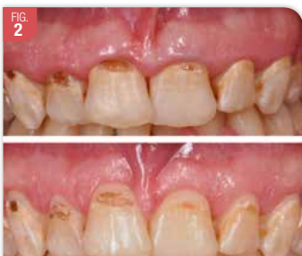
Situation avant / après chirurgie. L'indication est fonctionnelle. La patiente n'a pas de gêne esthétique ; elle n'avait pas conscience d'avoir de petites dents. La chirurgie a été réalisée pour permettre la réalisation des soins dentaires.

Par ailleurs, les indications ne sont pas uniquement esthétiques. Il y a aussi des indications fonctionnelles (Fig. 2). Par exemple, l'EPA peut compliquer la pose d'un appareillage orthodontique ou la réalisation de soins dentaires conservateurs ou prothétiques.