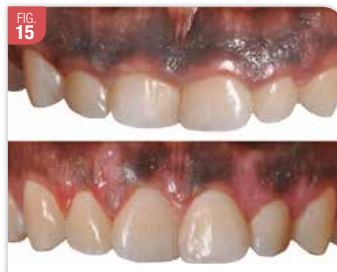
FIG. 15 Situation avant / après chirurgie du cas illustré de la Fig. 8 à 14. Patiente de 20 ans ayant été adressée par un orthodontiste chez qui elle était allée consulter pour corriger l'esthétique de son sourire qu'elle jugeait trop « enfantin ».