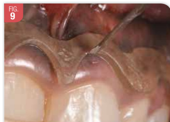
La qualité du guide numérique lui permet de jouer pleinement son rôle lors du tracé d'incision. La lame glisse parfaitement dessus et on obtient un tracé régulier et fidèle au projet initial.

technique de la gingivectomie moins opératoire dépendant. D'une part, le guide respecte parfaitement le projet esthétique. D'autre part, la découpe du guide est lisse et régulière, c'est-à-dire avec une angulation constante. On peut poser la lame sur le bord du guide et obtenir un tracé dont la position, la forme et l'angulation sont fidèles à la planification (Fig. 9). Donc, nul besoin d'être un artiste pour faire une incision qui respecte tous les critères de l'esthétique dentaire et parodontale. Grâce au numérique, la gingivectomie est plus accessible, reproductible et simple. Si le guide est une bonne option, notamment pour les premiers cas, ça ne résout pas tout. Ce n'est qu'un outil qui ne sert que pour la première étape de la chirurgie.