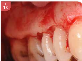
FIG. 13 L'os a été réduit en hauteur pour rétablir un espace biologique de 2 mm entre la JAC et la crête osseuse. Mais, il y a un balcon osseux important. La réséction osseuse doit donc se faire ensuite en épaisseur.

Les corrections se font en combinant l'utilisation de fraises avec une bonne irrigation, de