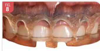
Guide chirurgical issu d'une planification numérique et réalisé avec une imprimante 3D