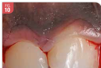
FIG. 10 Incisions festonnées, sous marginales qui se croisent à la base des papilles. On complète par une incision sulculaire jusqu'à la base du sulcus.

Puis, le sommet de la papille est dés-épithélialisé et le lambeau est décollé en demi-épaisseur à ce niveau. La papille n'est pas décollée (Fig. 12). En palatin, on réalise une gingivectomie sans toucher aux papilles. Heureusement, il est fréquent de n'avoir à traiter que le secteur vestibulaire. Donc, le risque de perte de papilles est plus limité.