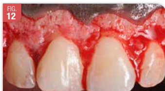
FIG. 12 Décollement du lambeau en demi-épaisseur en regard des papilles, en épaisseur total ailleurs. La papille est préservée. La crête osseuse est à proximité de la JAC.