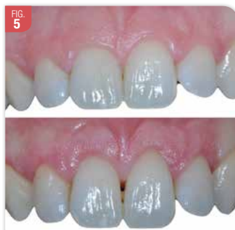
Situation avant / après chirurgie. Il n'y a pas d'alignements des collets 11/21. Et, il y a perte de la papille inter-incisive.

Le guide peut être réalisé au moyen d'une gouttière thermoformée qui est découpée en suivant sur un modèle en plâtre un tracé d'incision fait préalablement au crayon. C'est simple à mettre en œuvre mais il y a deux inconvénients (Fig. 6, 7) :