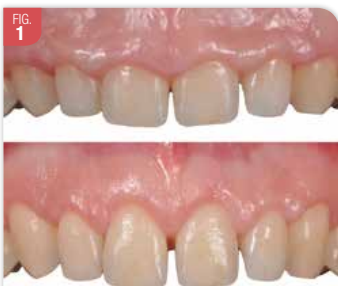
Situation avant / après chirurgie de correction d'une EPA. La patiente a 16 ans et l'indication est esthétique. La patiente se plaignant d'avoir des petites dents.

Les patients avec une EPA peuvent consulter car ils ont une gêne esthétique (1). Ils se plaignent de la petite taille de leurs dents, comme « celles d'un enfant » et qu'on voit trop de gencive au sourire (Fig. 1). Par défaut d'information, certains d'entre eux ont parfois attendu longtemps avant de consulter. Mais, tous les patients ne sont pas demandeurs de corrections. L'EPA n'implique donc pas systématiquement un traitement.